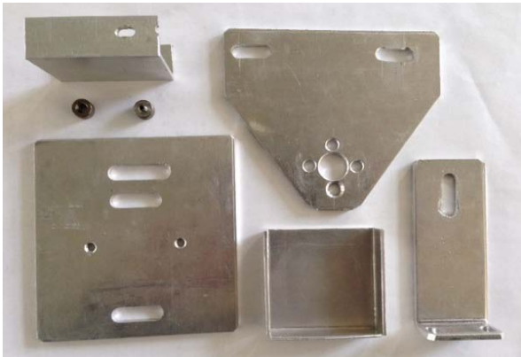
図6 対象校で製作した部品